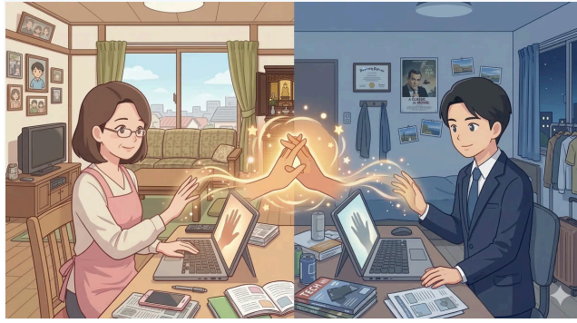
タンジブル・ビットのイメージ

——デジタルとアナログの融合ですね。それが今の社労士業務にどう繋がっているのでしょうか。