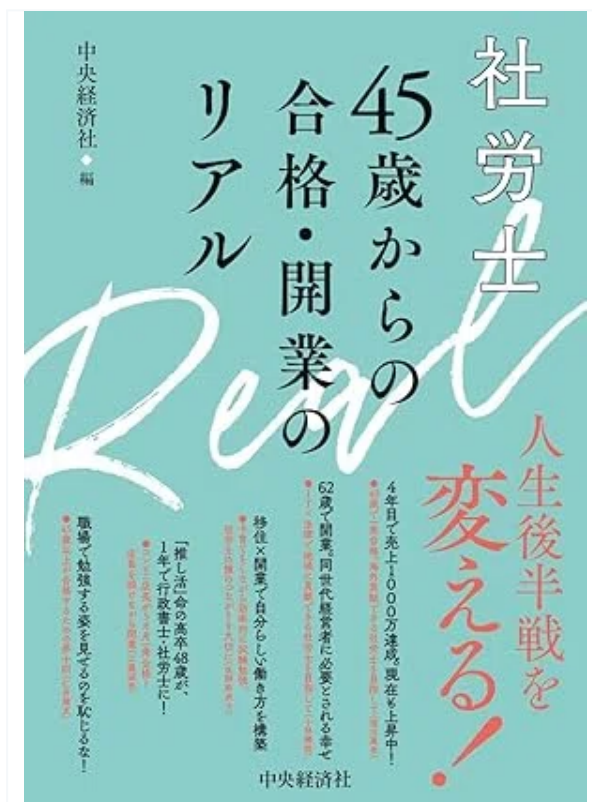
社労士45歳からの合格・開業のリアル